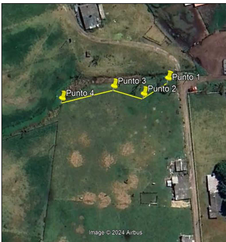
Ilustración 1. Recorrido

Con base en lo anterior, el día 05 de diciembre de 2024 se realizó recorrido de control y vigilancia en el humedal Gualí desde las coordenadas 4°47'20,486" N- 74°13'3,950" W hasta las coordenadas 4°47'22,502" N- 74°13'4,801W (ver ilustración 1. Ruta amarilla) vereda Cacique sector Tienda Nueva, ecosistema que fue declarado por la Corporación Autónoma Regional de Cundinamarca - CAR como Distrito Regional de Manejo Integrado a través el acuerdo 001 de 2014 "Por medio del cual se declaran como Distrito Regional de Manejo Integrado (DMI), los terrenos comprendidos por los humedales de Gualí, Tres Esquinas y Lagunas de Funzhé, y su área de influencia directa ubicada en los municipios de Funza, Mosquera y Tenjo, Cundinamarca", y estableció tres zonas: 1. Preservación (espejo de agua), 2. Recuperación (50 metros) y 3. Uso sostenible (100 metros).